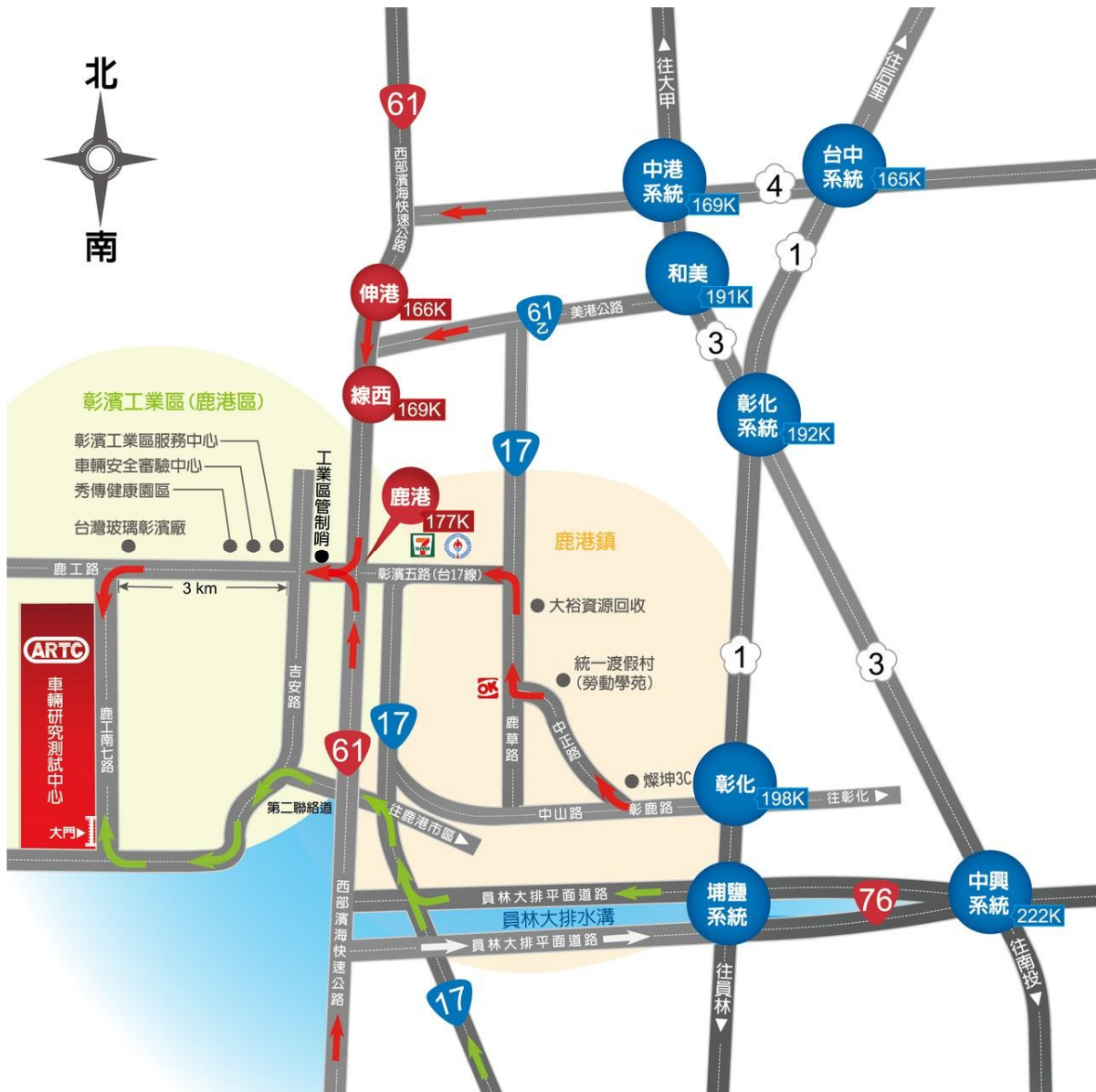
ARTC 車輛中心：50544 彰化縣鹿港鎮鹿工南七路 6 號